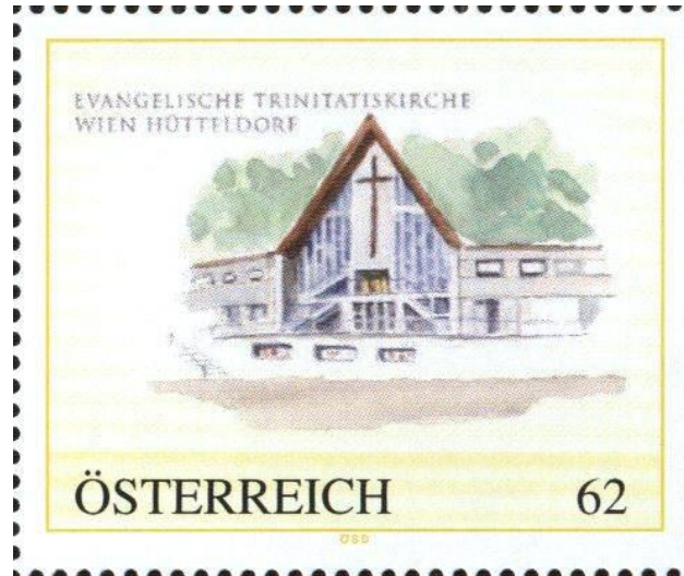
Briefmarke der Österreichischen Staatsdruckerei, herausgegeben 2012

Der Pfarrer leitet die Pfarrgemeindegemeinschaft mit einer engagierten Schar von Mitarbeiterinnen und Mitarbeitern.